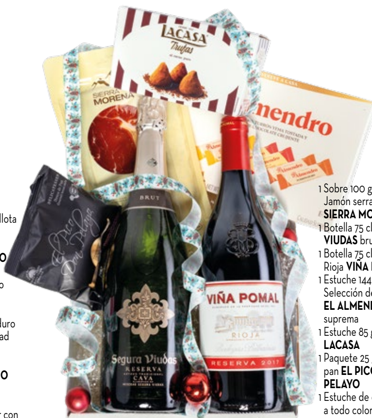
Estuche 708 26,15 € + I.V.A.