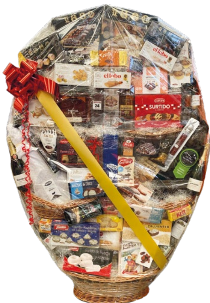
Muestra únicamente de presentación de la Cesta XXL, no de productos