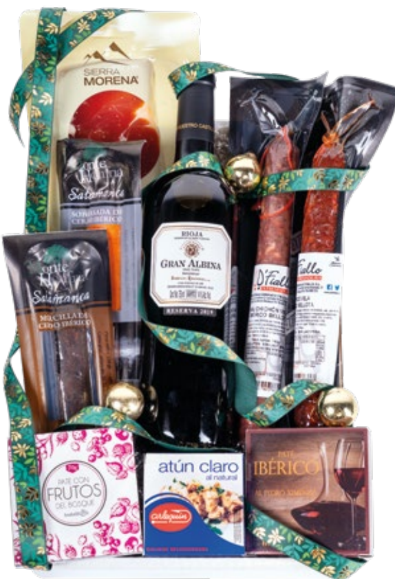
Estuche 706 22,61 € + I.V.A.