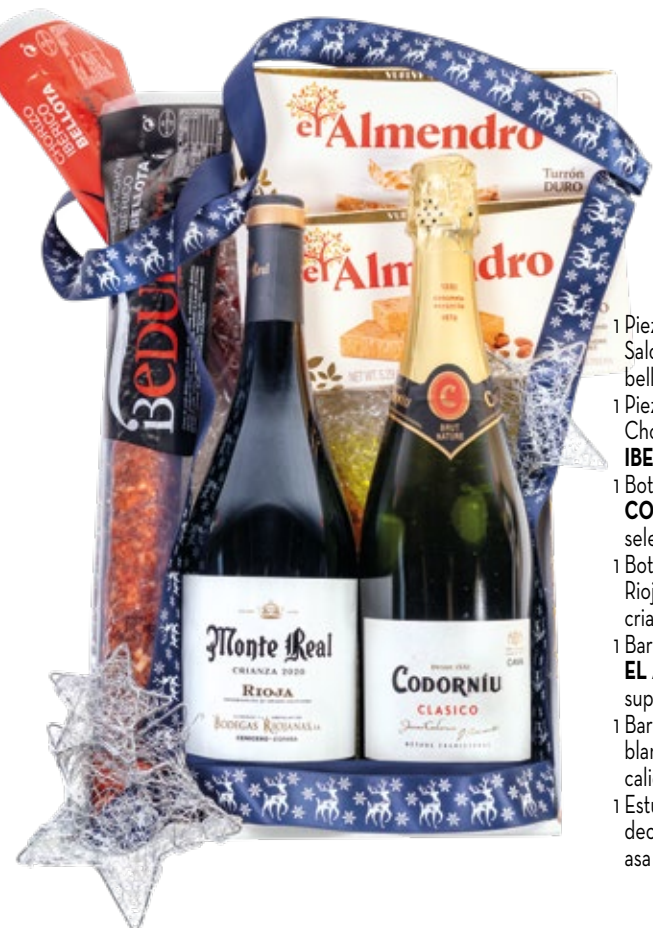
Estuche 707 24,43 € + I.V.A.